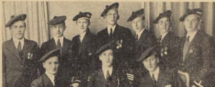
Skansens bataljons offiserer.