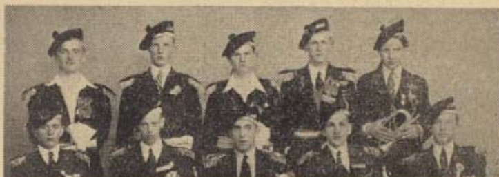
Sandvikens bataljons offiserer.

I guttenes billettpriser er inkludert middag og aftenens ombord. For øvrig vil komiteen i første rekke sørge for at guttenes utbytte av turen blir et minne for livet. At nettopp disse to korps har funnet hverandre til denne fellesturen er gledelig. Samholdet imellem sandviksgutter og skan-