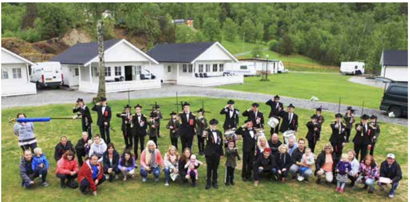
Deltakerne hadde en trivelig landtur 2013.