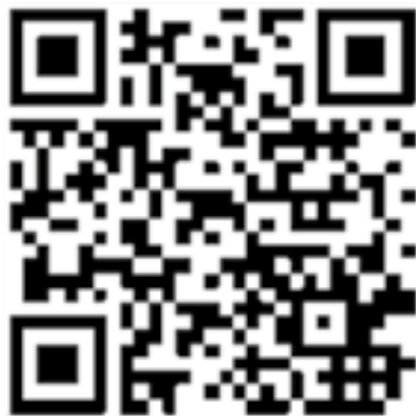
QR-kode hjemmeside http://www.sandvikensbataljon.no