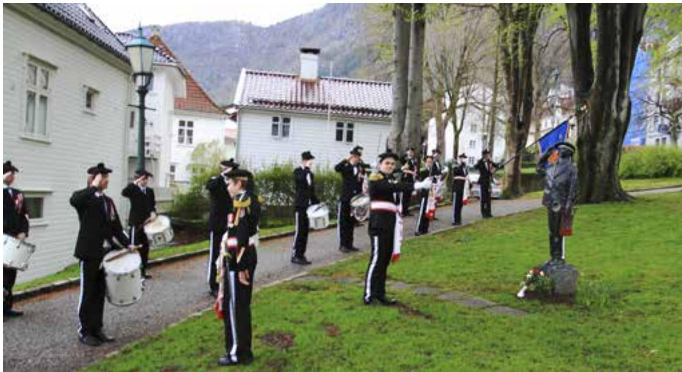
Fra morgenrunden 17. mai.

der den tradisjonelle slagerkonkurransen foregår. Etter to økter her gikk ferden videre til «Hesten trenger hvile» og servering av boller og brus eller vann alt ettersom.