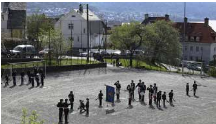
Sandvikens bataljon på Mulebanen.