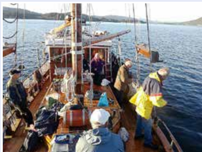
Fiskerne er godt igang.

Været startet ikke helt lovende med lyn og torden og en ordentlig flo-byge. Senere ble det bare bedre, og til slutt skinte solen. Fisketuren 2013 går derfor inn i historien som minneverdig og med rekordfangst. Atter fikk kattene i Sandviken en lykkelig junikveld.