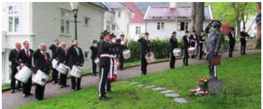
Morgenrunden 17. mai.