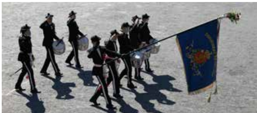
Fellesoppvisning på Mulebanen.