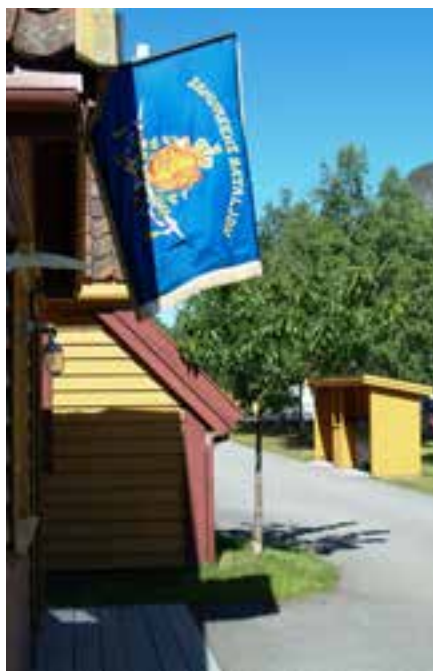
Sandvikens bataljon på landtur.

Luftpistol og luftgeværskyting var neste på programmet. Her skyter de minste med pistol mot store skiver, de aller yngste på 7,5 m og de litt eldre på 10 m. De større skyter med luftgevær på små skiver på 20 m avstand. Som vanlig var det variert skyting. Noen var gode