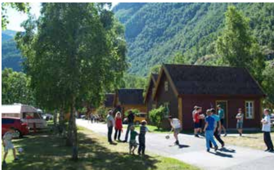
Fra landturen Lærdal.

og andre ikke helt topp. Her er premiene plaketter til nr 1 og 2 i hver klasse, med vandrepokal til beste skytter uansett klasse.