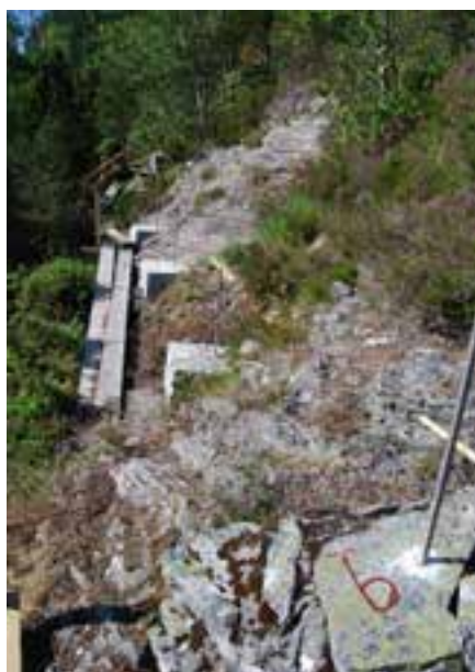
Fundamentene på plass

1. mai ble det årets hoveddugnad avholdt. Målet denne gang var å bære frem stein til murstøttene for stålrennen. Dagen før ankom et lass med stein (mye stein) som var transportert helt fra Karmøy. En tilstrekkelig mengde av denne skulle bæres på ryggen opp i skråningen slik at de var klare til en senere dugnad hvor murstøttene skal bygges opp i riktig høyde. 4 korpsgutter pluss 4 gamlekarer