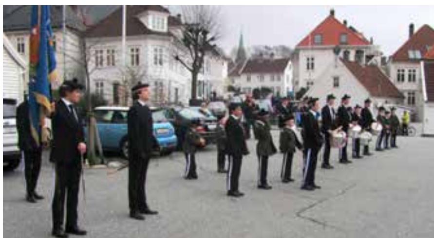
På Sandvikstorget første eksersis dag.

Etter prosesjonen ble korpset dimmittert på