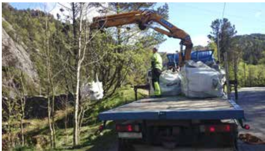
Narurstein fra Karmøy lastes av ved demningen i Munkebotn.

fra Sandvikens og Dræggens deltok. Resultatet ble at vel 100 solide naturstein ble båret i sekker og bæremeis opp en lang stige som var plassert i skråningen. Det var de fire korpsguttene som sto for de tyngste takene, og det var på slutten av dagen mange ømme lårmuskler.