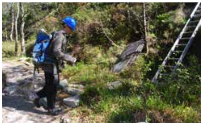
Rene Haldorsen gjør klar til å entre stigen med en tung stein i sekken.

I forrige nummer av bladet hadde vi en lang reportasje om Munkebotn Sti og Renneprosjekt. Dette er en liten statusrapport. I neste nummer håper vi å kunne rapportere at hele den nederste del av rennene er på plass.