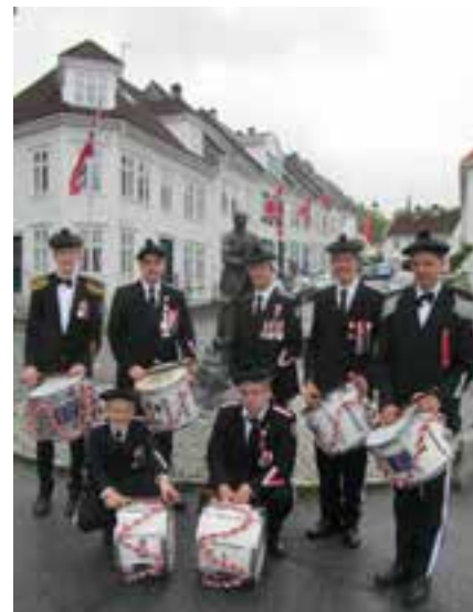
Slagerjengen 17. mai.

Det neste store var 17.mai, vår 157. stiftelsesdag! Det må nevnes her at før selve dagen var det hektisk aktivitet blant slagerne.