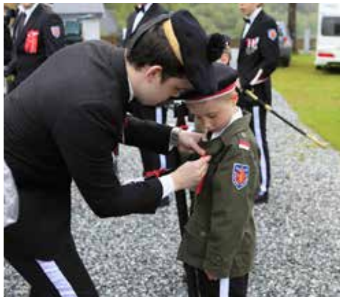
Sjefen deler ut hederlig til alle som var med på tur.

I Dræggen sto det, som alltid en god del folk og ventet da vi ankom. Nå var det oppstilling og utdeling av hederliger til de som ikke hadde vært med på turen. Det var også møtt opp en del gamlekarer som skulle marsjere sammen med oss til Sandvikstorget. Mens Bataljonen marsjerte utover, var andre i gang med klargjøring på Sandvikstorget. Bord ble satt opp, pokaler, premier, medaljer og ordener ble satt opp og lagt ut, så alt var klart til Bataljonen marsjerte inn. Det hadde samlet seg masse folk på tross av at