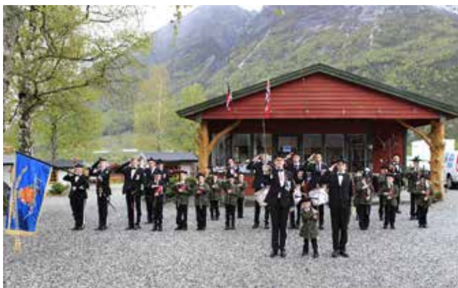
Korpset er klar for hjemreise.