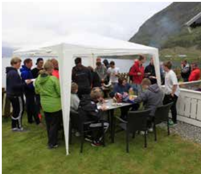
I full gang med grilling.