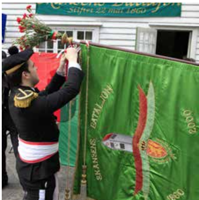
Forskjellige glimt fra sesongen 2015